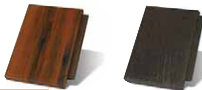
colorsystem ANTICKÁ ČERVENÁ